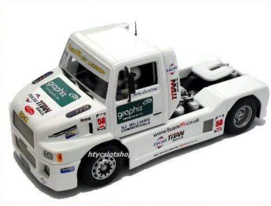
SISU SL 250 BRANDS HATCH ANDY LOVENBERRY