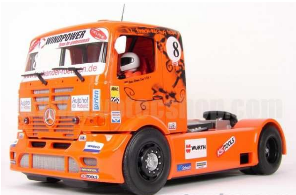
MERCEDES ATEGO ZOLDERS 2012