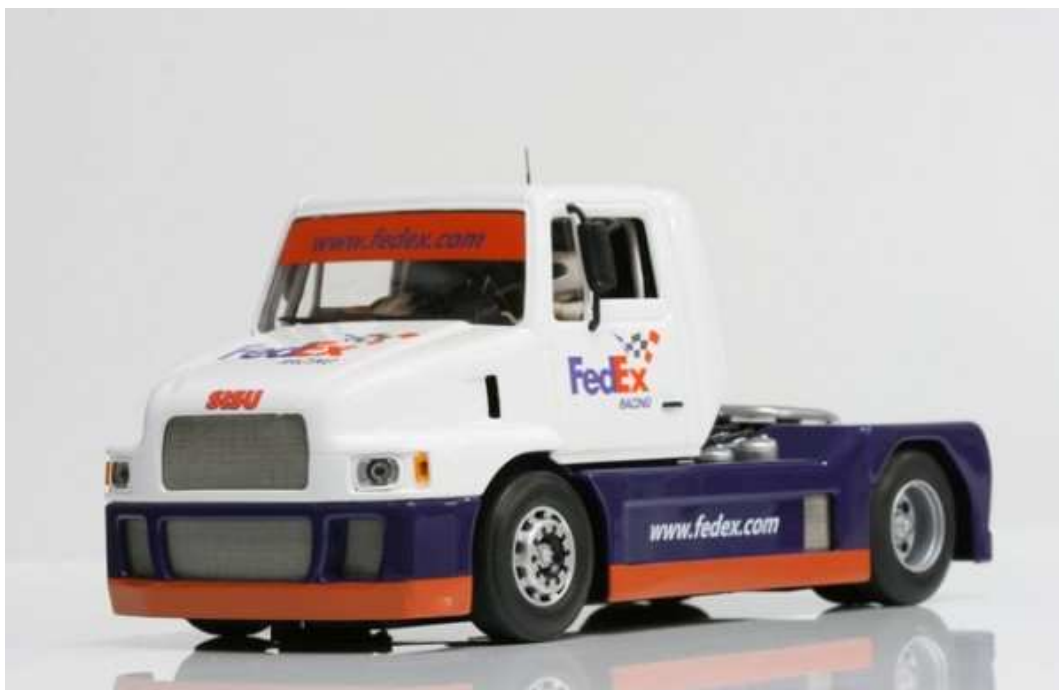
SISU SL 250 Fedex "USA Limited Edition"