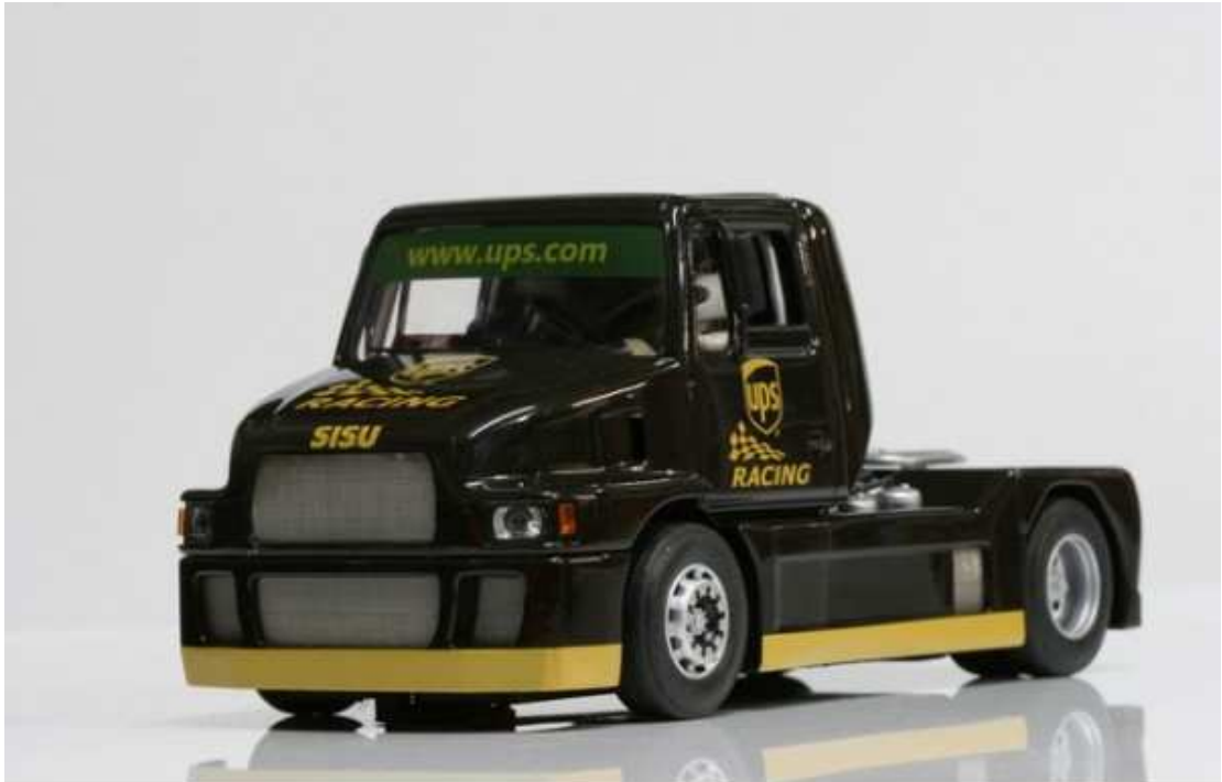
SISU SL 250 UPS "USA Limited Edition"