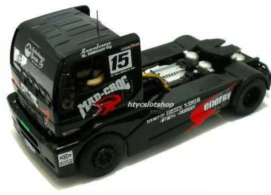
Man TR 1400 Misano FIA ETRC 2012